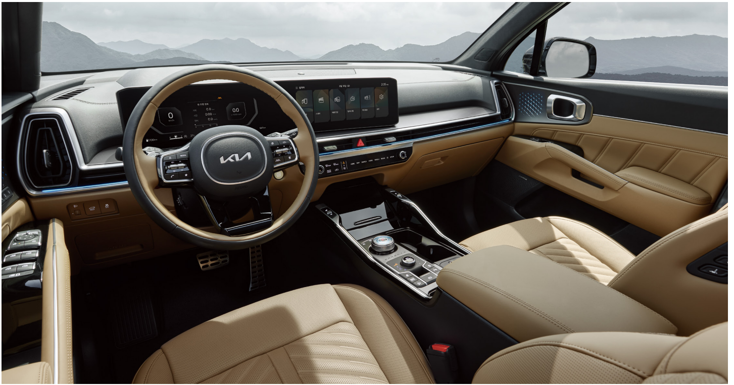
올리브 브라운 인테리어