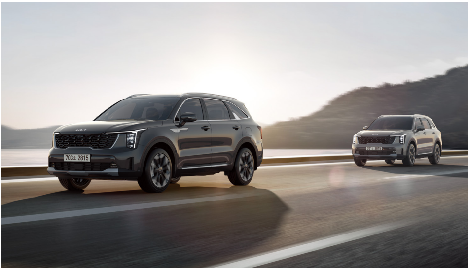
고속도로 주행 보조 2