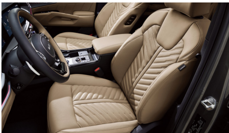
운전석 에르고 모션 시트