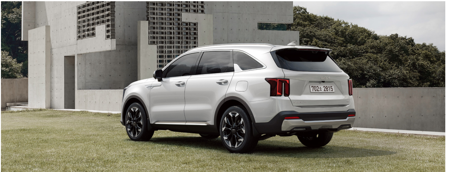
스노우 화이트 펄 (SWP)