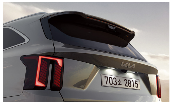
LED 리어콤비네이션 램프