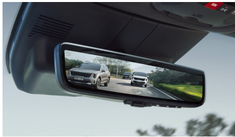
디지털 센터 미러