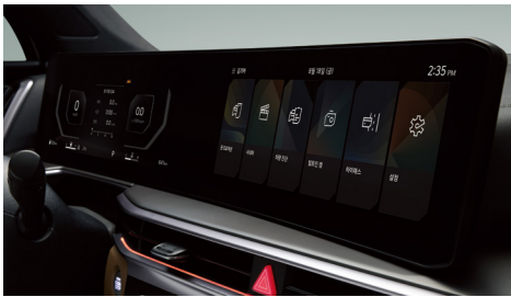
12.3인치 클러스터 & 내비게이션