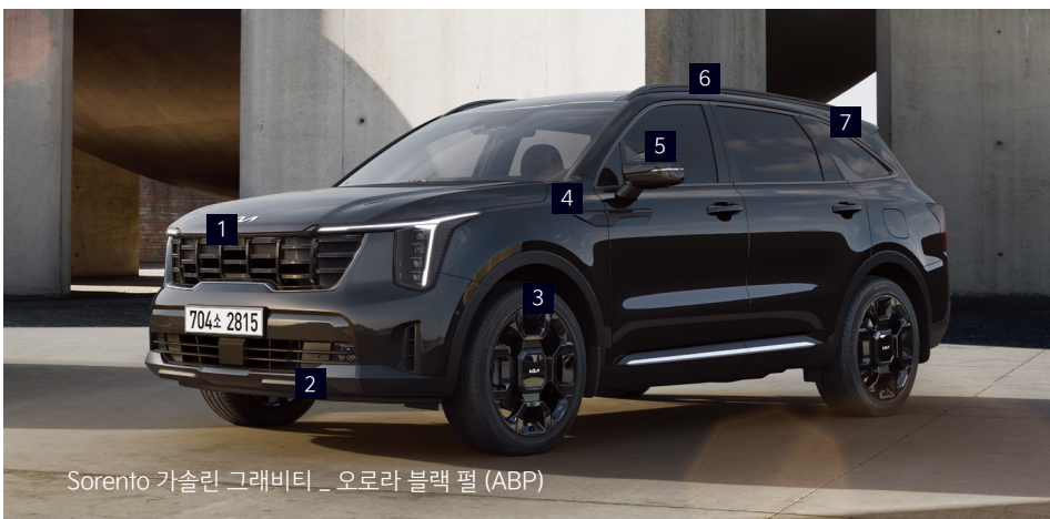
Sorento 가솔린 그레비티 _ 오로라 블랙 펄 (ABP)