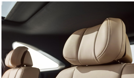
윙 아웃 헤드레스트