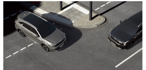
전방 충돌방지 보조