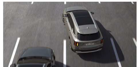
후측방 충돌방지 보조